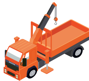
小型移動式クレーン運転技能講習