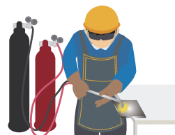
ガス溶接技能講習