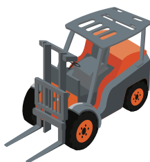
フォークリフト運転技能講習