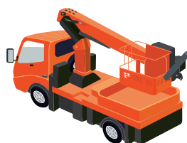
高所作業車運転技能講習